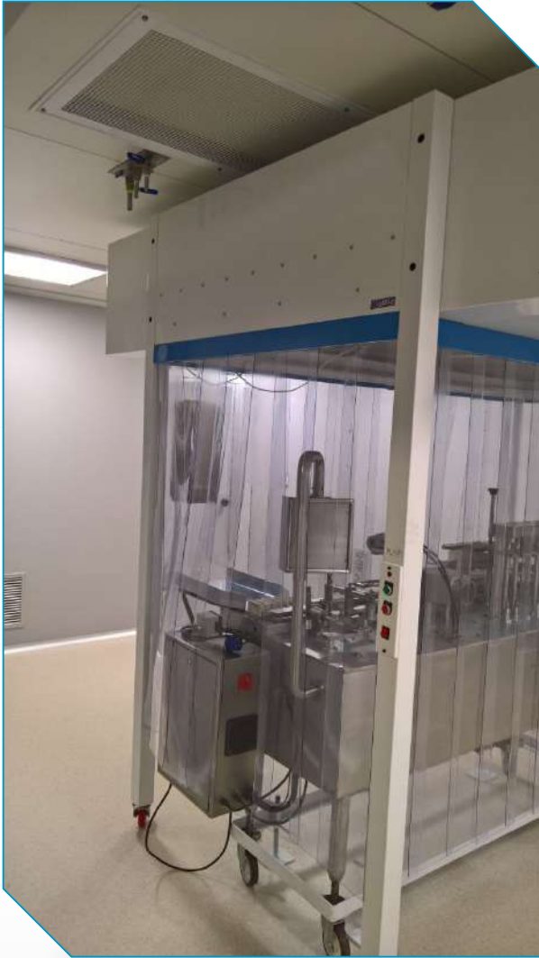
Terminación pintura epoxy