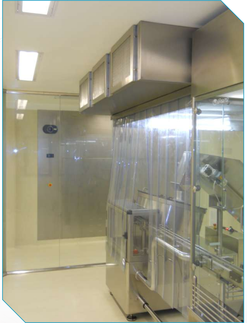
Terminación acero inoxidable